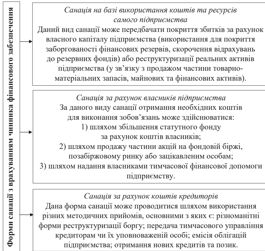
Рисунок 3 – Форми санації з врахуванням чинника фінансового забезпечення