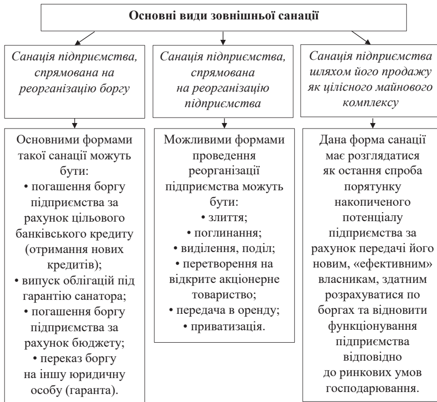
Рисунок 1 – Основні види зовнішньої санації підприємства