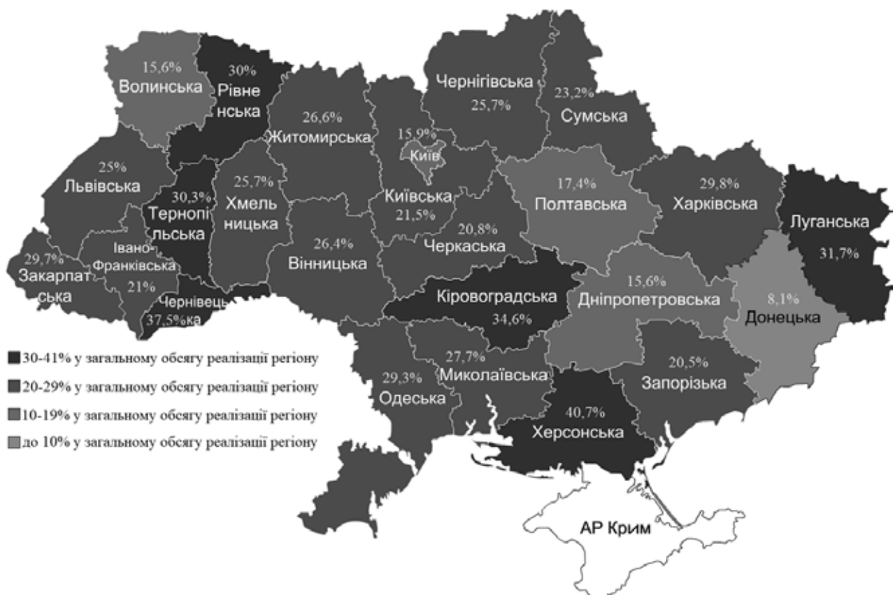
Рисунок 2 – Питому вагу суб'єктів малого підприємництва в обсязі реалізованої продукції за 2019 р.