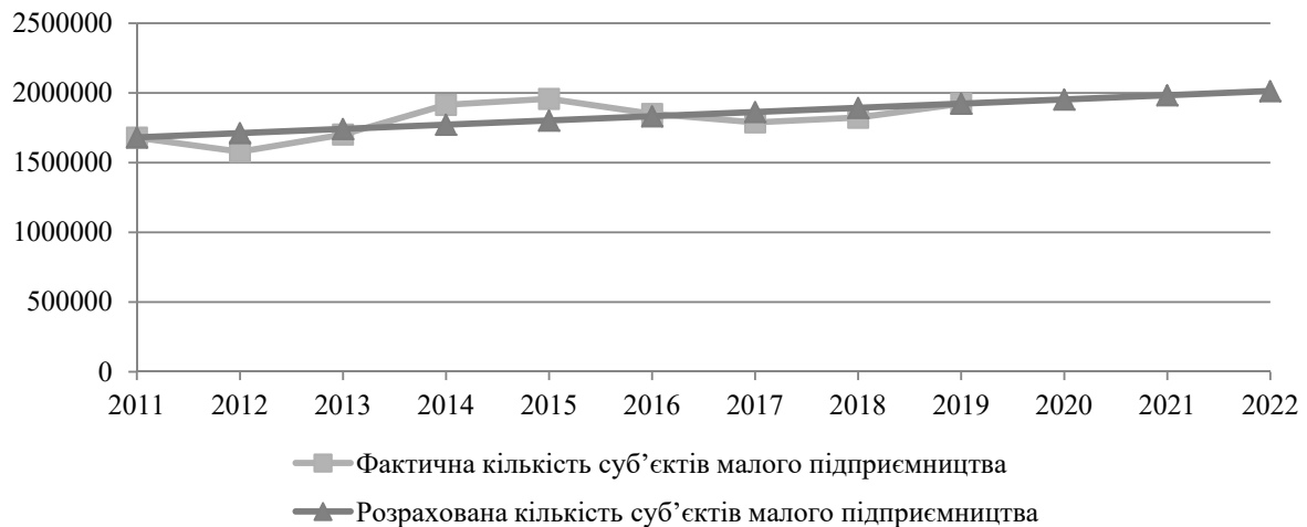
Рисунок 4 – Розраховане рівняння тренду кількості суб'єктів малого підприємництва в Україні

– локальність ресурсів і збутових ринків, а отже, межі для зростання;