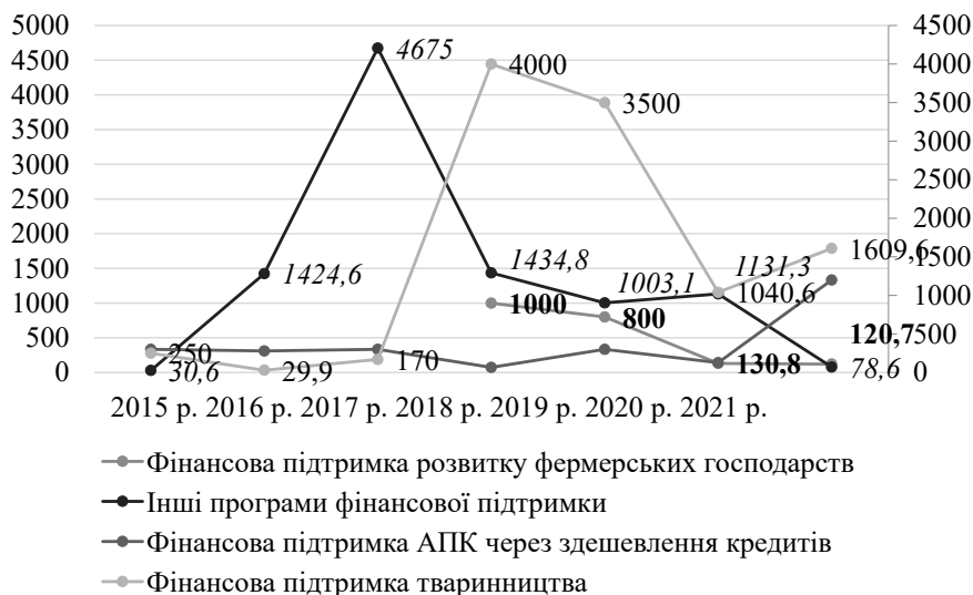
Рисунок 4 – Динаміка обсягів державної фінансової підтримки аграрного сектору України, млн грн