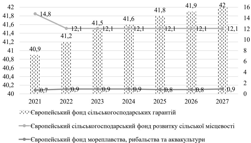
Рисунок 2 – Обсяги фінансового забезпечення розвитку інклюзивного сільського господарства і сільських територій у ЄС у 2021–2027 рр., млрд євро