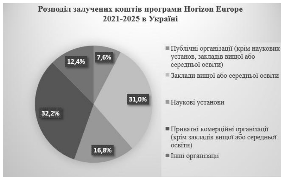
Рисунок 2 – Розподіл залучених коштів програми Horizon Europe 2021–2025 в Україні (бізнес vs академічний сектор)

Європейський банк реконструкції та розвитку (далі по тексту – EBRD) у 2025 році виділив Україні рекордні 2,9 млрд. євро фінансування, порівняно з 2,4 млрд. євро у 2024 році, що демонструє його незмінну відданість підтримці економіки [12, 13]. EBRD зберіг сильну увагу на підтримці енергетичного сектору, а другий рік поспіль понад 90% проектів та 57% його інвестицій були спрямовані на приватний сектор. З моменту початку повномасштабної війни EBRD виділив Україні загалом 9,1 млрд. євро [12]. EBRD продовжуватиме надавати Україні щонайменше 1,5 млрд. євро на рік під час війни, з можливістю подальшого збільшення після початку реконструкції. Ці наміри підкріплені угодою 2023 року про збільшення сплаченого капіталу EBRD на 4 млрд. євро, що підтримує надання підтримки Україні. Збільшення капіталу вже забезпечено на 95% [12].