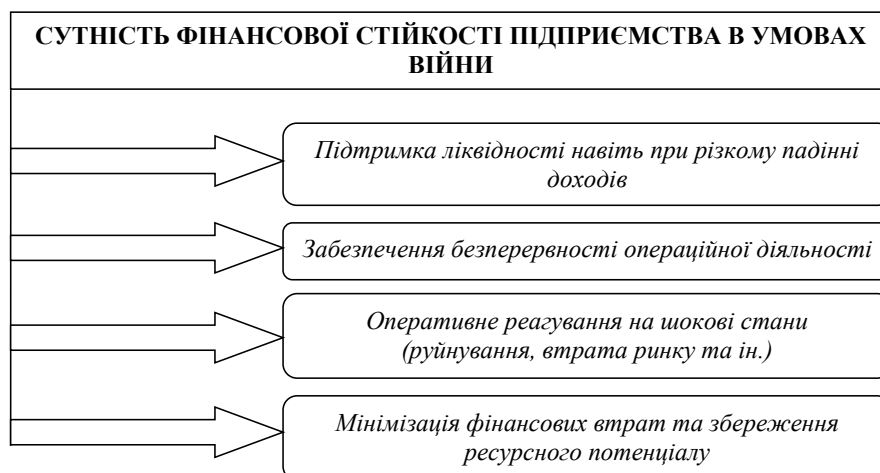
Рисунок 1 – Особливості трансформації фінансової стійкості підприємства у період війни

Зауважимо, що покращення фінансової стійкості підприємства в умовах повоєнного відновлення є критично важливою, адже першочергово це має на меті